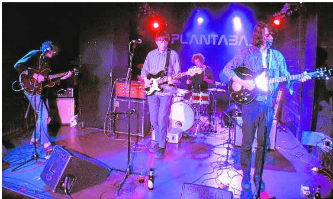
El cuarteto británico The Proper Ornaments, durante su concierto en el Planta.