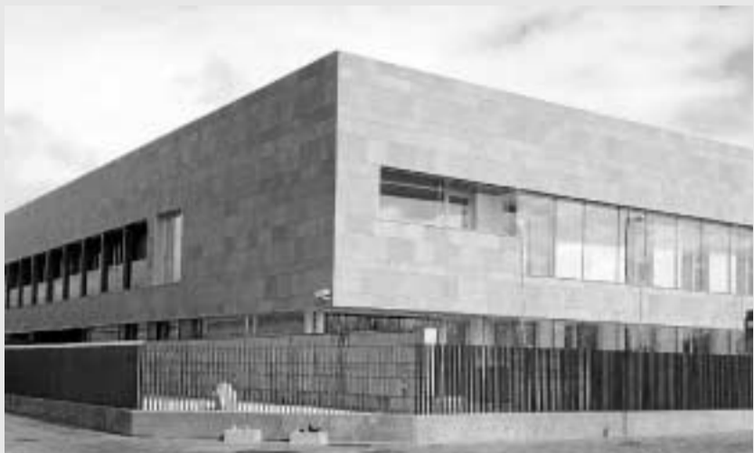
▲ Manantia Eco Business. Edificio de oficinas en carretera de Córdoba.