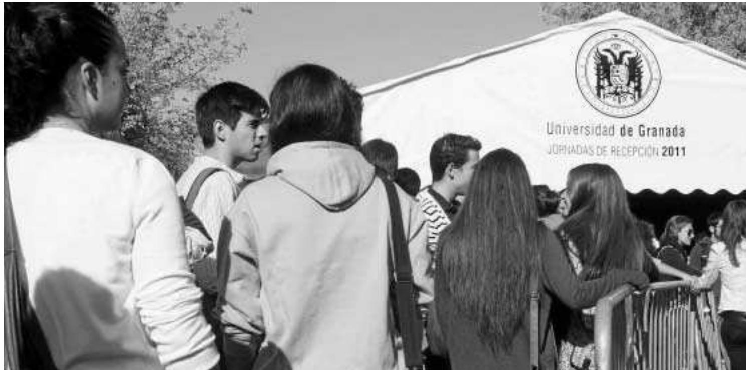
Los estudiantes suelen tener porcentajes muy bajos de participación en la elección del rector de la UGR.