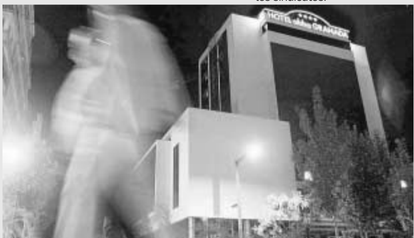
▼ Hotel Abba. En el antiguo edificio de los sindicatos.