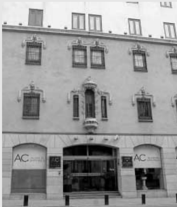
▲ Hotel Santa Paula. Antiguo Convento del mismo nombre y casa Morisca.