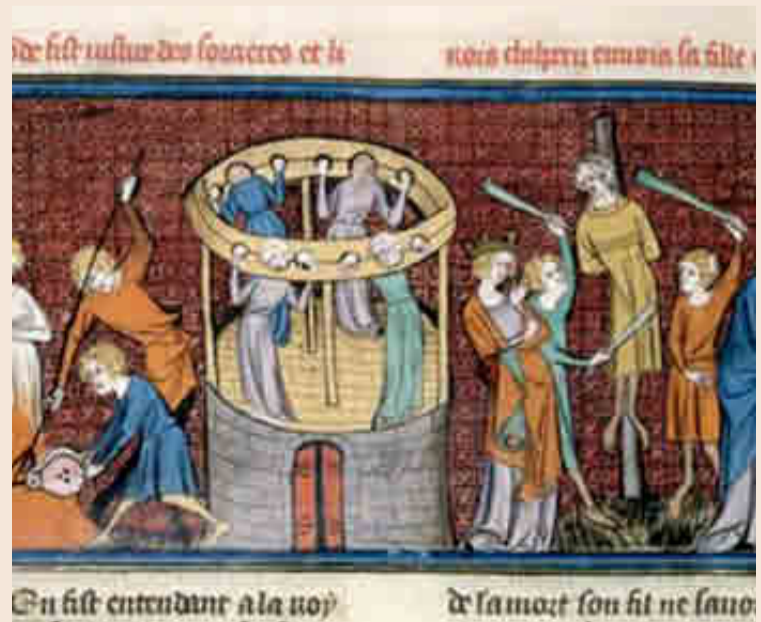
La semana pasada se habían registrado en este curso más de 2.700 personas.

tes de tercer ciclo ARDIT Culturas Medievales, el Instituto de Investigación en Culturas Medievales (IRCVM) y el Máster de Culturas Medievales de la UB. Tanto los organizadores como los docentes son jóvenes investigadores (doctorandos e investigadores posdoctorales), salvo en el caso del módulo cuatro, que impartirán profesores de la Universidad Católica de Lovaina. El curso se ofrecerá en inglés desde la plataforma Coursera, pero con subtítulos en inglés, catalán y castellano.