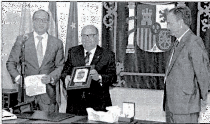
Durante el acto recibió regalos y recuerdos

El meteorólogo, en su línea de sencillez, agradeció las emotivas