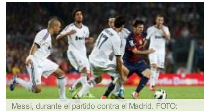
Messi, durante el partido contra el Madrid. FOTO: