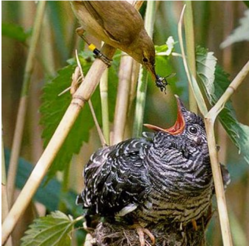
La hembra del Cu Cú es de temer.

Publicado el Miércoles, 25 Julio 2012 14:54