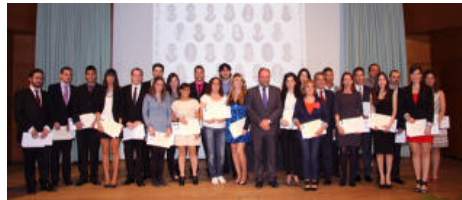
Foto de familia de los premiados.