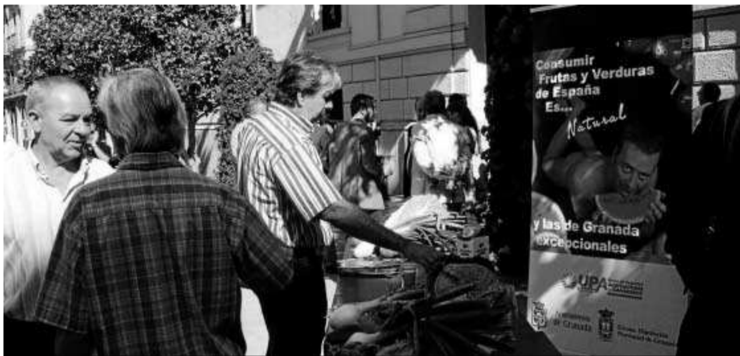
Quienes pasaron por la Plaza del Carmen se encontraron con la campaña de UPA.

La Unión de Pequeños Agricultores ofrece zumos naturales para promocionar los productos autóctonos