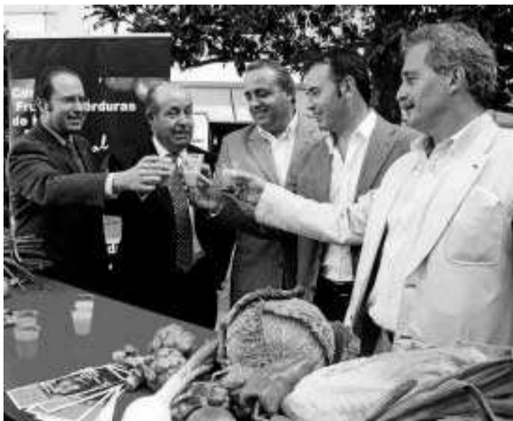
El alcalde y miembros de UPA brindan con gazpacho.

El acto también sirvió para presentar la siguiente fase de la campaña Consumir frutas y verduras de España es... natural y Las de Granada, excepcionales , consistente en la instalación de expositores informativos todos los domingos a lo largo del mes de octu-