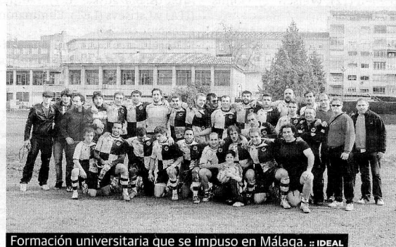
Formación universitaria que se impuso en Málaga. :: IDEAL