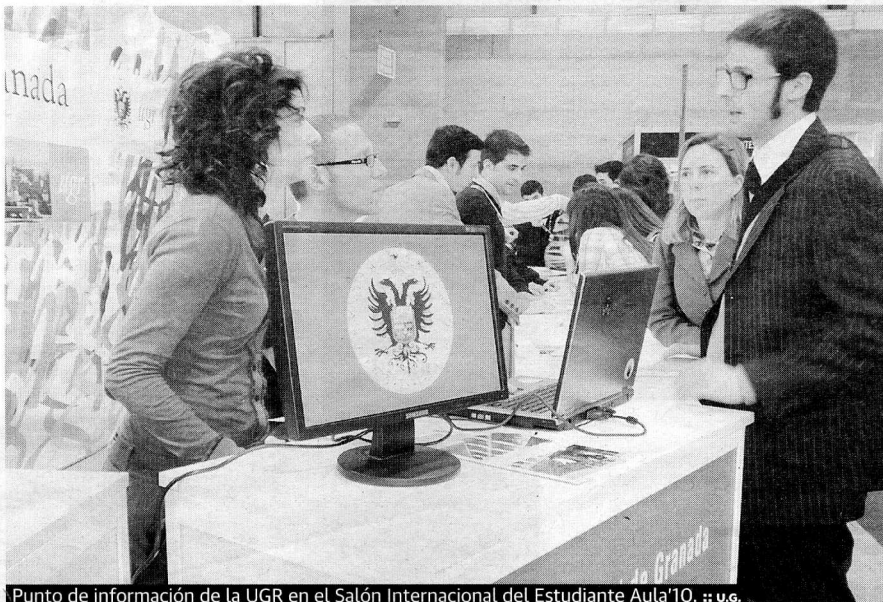
Punto de información de la UGR en el Salón Internacional del Estudiante Aula'10. ■ u.g.

Uno de los últimos contratiempos ha sido el plan de estudios. «Ha habido una sucesión de planteamientos por parte del Ministerio, de los colegios profesionales, de las escuelas y creo que estamos en vías de resolver», sostenía el rector. Si bien, cuando este periódico habló con él aún no había solución definitiva. La profesión de arquitecto es una de las pocas que están reguladas por directiva europea. El problema llegó cuando se aplicó una normativa y se dieron una serie de créditos con los que no estaban conformes los profesionales y estudiantes. Se han realizado, incluso, manifestaciones en Madrid. Ha habido una negociación de meses a nivel nacio-