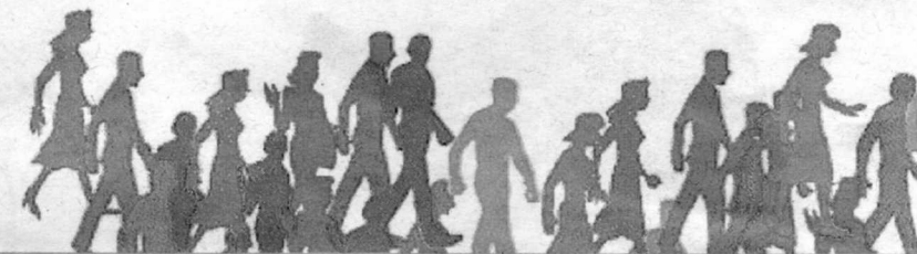
La lengua gallega se ha convertido en la lucha de la sociedad y la Xunta.