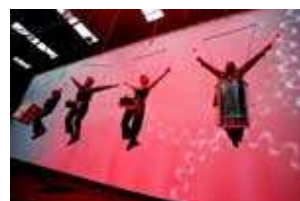
Strass et paillettes à la