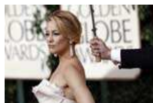
Glamour aux Golden