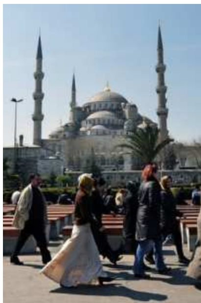
Des passants devant la Mosquée bleue d'Istanbul, le 3 avril 2009

Cette contradiction apparente s'explique par le fait que "si vous forcez les gens à se déterminer dans un référendum, ils hésitent à changer les choses, ils penchent pour le statu quo, alors qu'ils ont plus d'audace lorsqu'on leur demande un simple avis, avec des nuances telles que 'êtes-vous favorable' ou 'plutôt favorable'", a expliqué Hakan Yilmaz, professeur à l'Université Bogazici, en présentant samedi soir cette étude à l'IFEA (Institut français d'études anatoliennes, Istanbul).