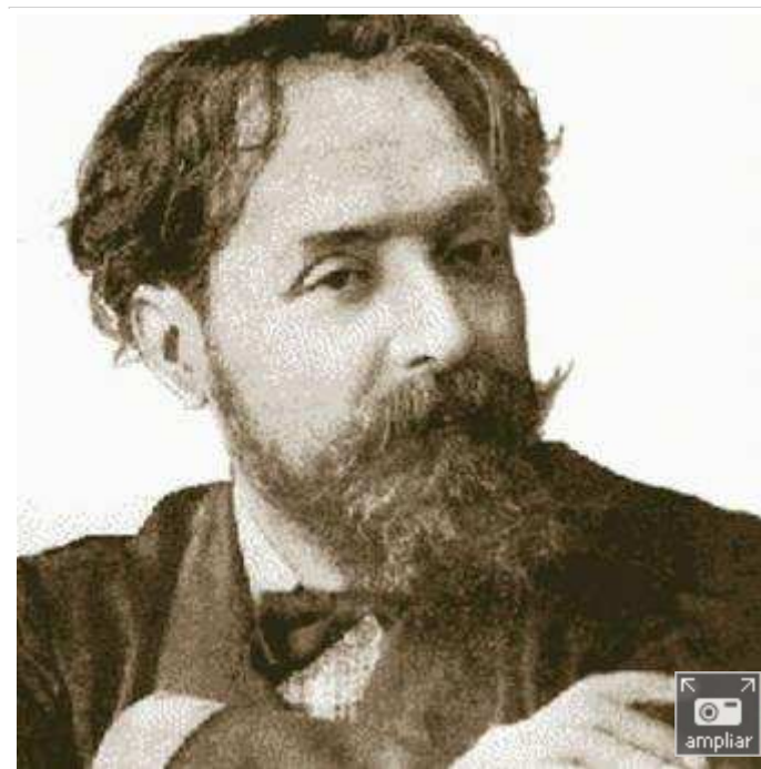
Alejandro Sawa, en una imagen de principios del siglo XX.-