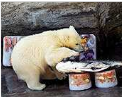
En el Zoo de Viena

Juega y Gana Enamórate Noticias en tu móvil Canal Inmobiliaria Loterías Formación Clasificados Guía QDQ